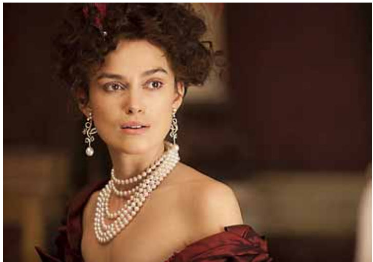
Keira Knightley in 'Anna Karenina'.

Sinds de verhuizing van het filmhuis naar het Oostereiland, het voormalige gevangeniscomplex in Hoorn, staat Cinema Oostereiland op de kaart. Regelmatig worden in Cinema Oostereiland dan ook landelijke premières gepresenteerd. In de wekelijkse rubriek 'Eilandpremière' wordt aandacht besteed aan nieuwe films.