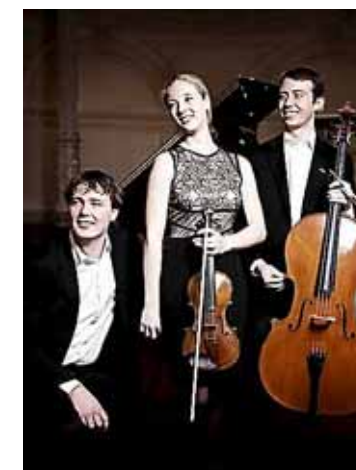
Het Mosa Trio.

veel afhangen van hun dapperheid en uithoudingsvermogen. De toeschouwers moeten de Foomps helpen en knutselen ook zelf een Foomp-poppetje. Spelers zijn muzikant en verteller Tom Haage en poppenspeler Mieke Driessen. Leefijd vanaf 4 jaar. Aanvang 14 uur. Entree €7,50. Reserveren kan via: info@kerkbeets.nl . Ook kaartjes aan de zaal.